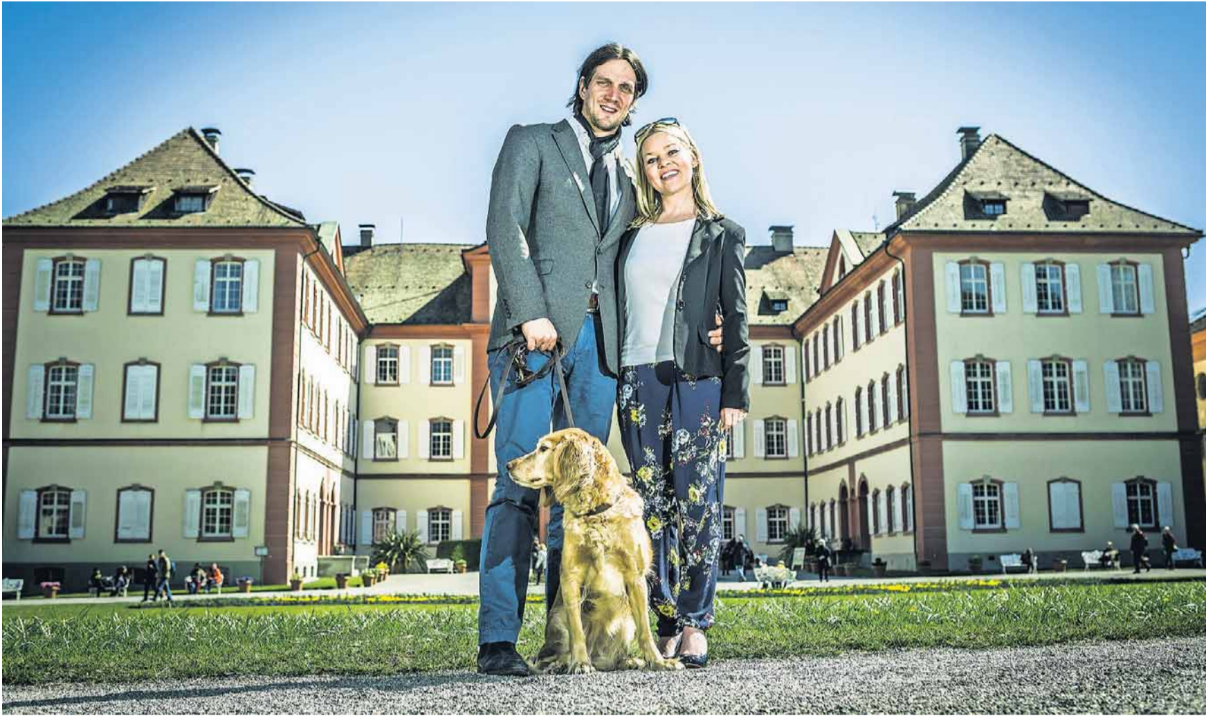
Björn Graf Bernadotte und Ehesfrau Sandra Gräfin Bernadotte mit Hund Thalia vor dem Schloss.

in ein Blumenparadies. Als erstmals Eintritt verlangt wurde, kostete dieser 99 Pfennig, inzwischen sind es 19 Euro.