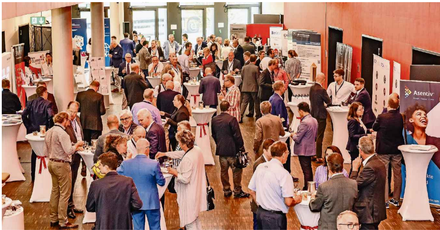
Interessante Diskussionen, wertvolle Kontakte: Die rund 300 Firmenvertreter unterhalten sich bestens am 10. KMU Swiss Podium.

Um den Austausch und die Begegnung ungezwungen zu fördern, laden die Gemeinderäte von Bözen, Effingen, Elfingen und Hornussen die ganze Bevölkerung zum «Adventsapéro» ein am Samstag, 1. Dezember, ab 17.30 Uhr, beim grossen Buswendeplatz in Elfingen.